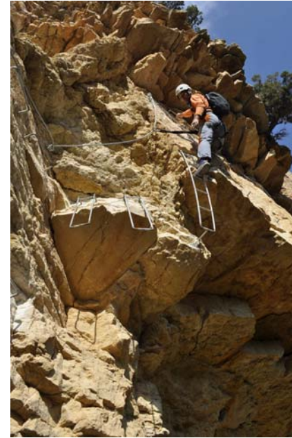
Les escales de Sant Jordi