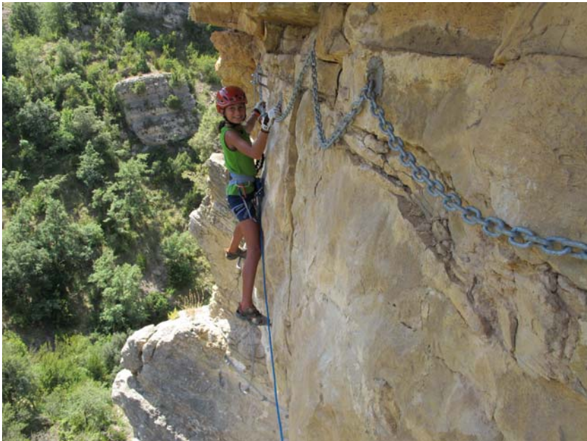
Travesia de los techos