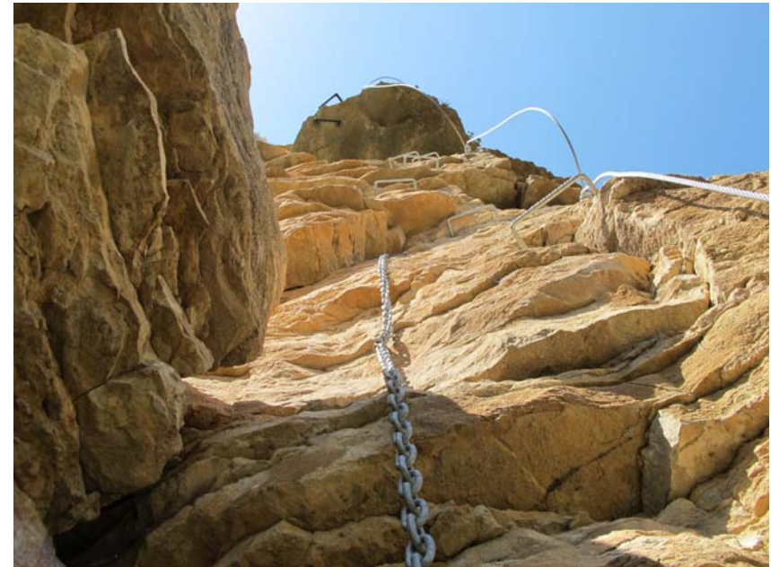
Techo con vistas