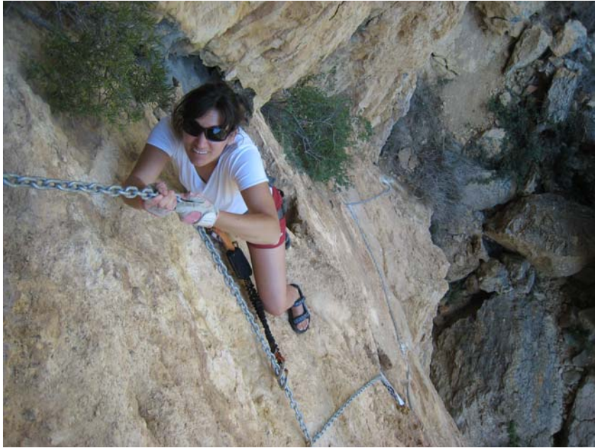
Primer tramo de cadenas